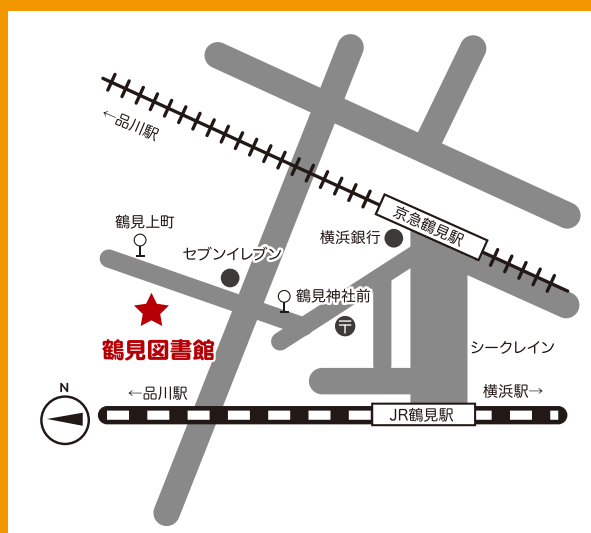
〈アクセス〉京浜急行京急鶴見駅、JR鶴見駅東口徒歩7分